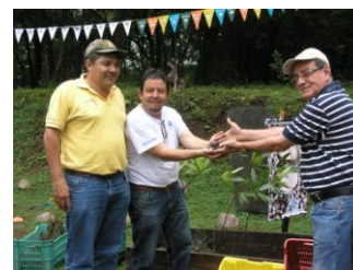
Entrega de Conchas Negras para Repoblamiento por parte del Vice Ministro del MARENA.

"Para los invitados esta fue una experiencia inolvidable y enriquecedora".