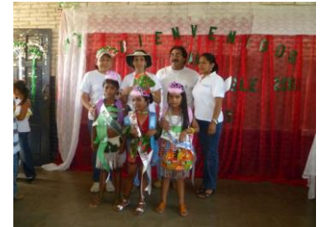
Princesitas del Mangle 1er, 2do y Miss Simpatía

“Este encuentro fue muy productivo porque conto con la participación de los niños y sobretodo el compromiso de protección al entorno”.