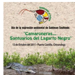
Lema del Evento: Camaroneras...Santuarios del Lagarto Negro

En conclusión con este evento Sahlman Seafoods reitera nuevamente su compromiso de proteger y promover la conservación de manglares en la zona de humedales.