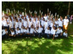
Listos para Reforestar

Desde el 2010 el tradicional Día del Mangle se convirtió en el Día de la Expresión Ambiental de Sahlman Seafoods . Los días 7 y 13 de Octubre nos reunimos para dar lugar al Día de la Expresión Ambiental de Sahlman Seafoods .