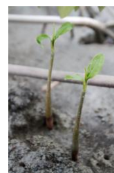
Mangle Rojo del programa de reforestacion

"Para los invitados esta fue una experiencia inolvidable y enriquecedora".