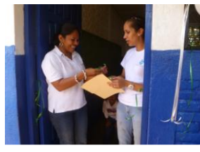
Corte de cinta para entrega de aula de Preescolar en Escuela Francisco Hernandez de Córdoba

Este año Sahlman Seafoods tuvo como meta incrementar la matricula de los niños de preescolar.